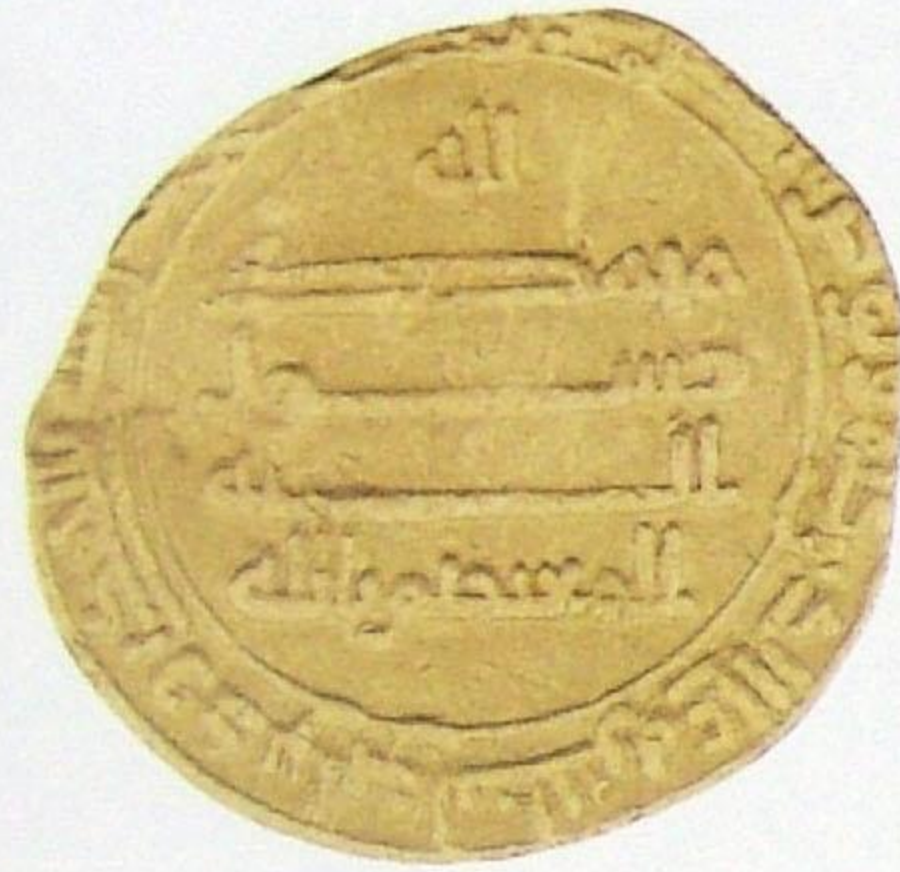
دينار عباسي المعتصم بالله ضرب: مصر سنة: ٢٢٠ هجري

Abbasids Dinar Al Moetsem Be Allah struck in Misr Year: 220 H